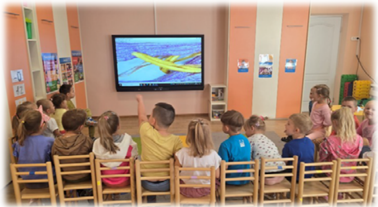
8 pav.: Vaizdas per mikroskopą (Vilniaus Salininkų lopšelis-darželis, Lietuva, Žvilgsnis per mikroskopą, „Gėlės anatomija“)