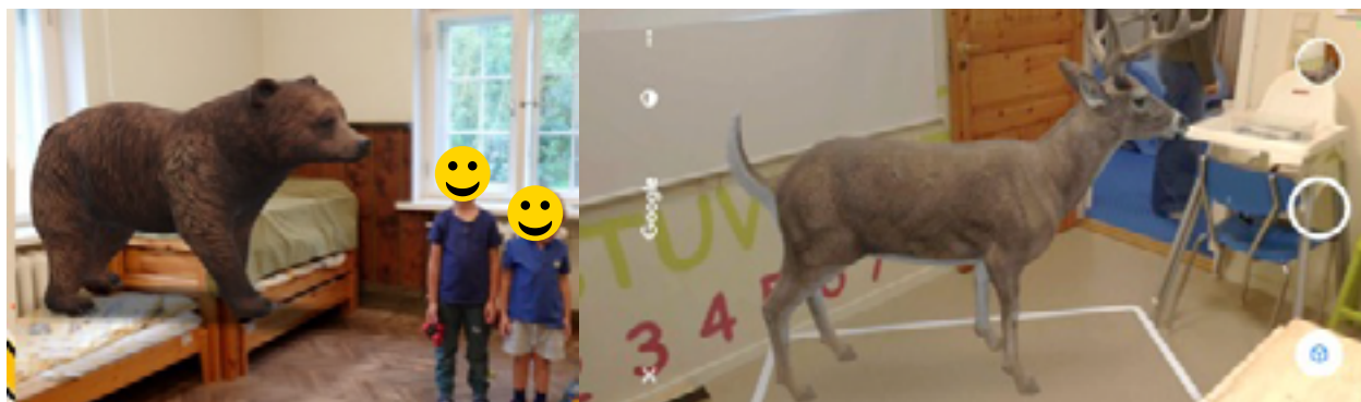
4 pav.: Sensomotorinė veikla, skirta algoritminiam mąstymui ugdyti (Kopli darželis, Talinas, Estija, ir Brennastubben Familiebarnehage, Oslo, Norvegija, Lokys arba Rudolfas 3D. Iššūkis: laukinių gyvūnų į grupės patalpą nesiveskite!).