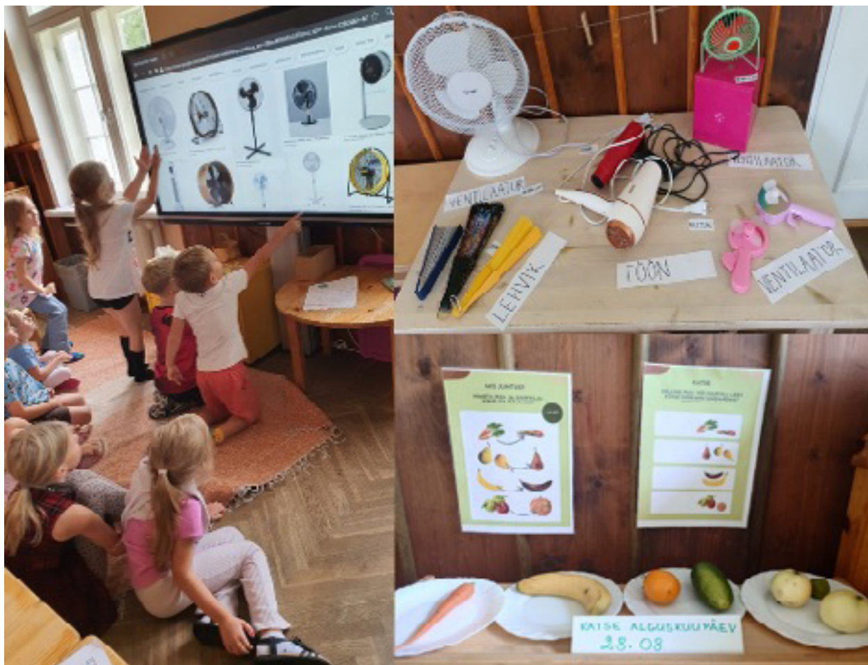
5 pav. Konkretizavimas padeda vaikams suvokti abstrakčius objektus, tyrinėti realius objektus siekiant ugdyti kompiuterinį mąstymą (Kopli vaikų darželis, Talinas, Estija). Vėją sukeliantys daiktai. ir ieškoma atsakymo į klausimą, kuris vaisius ar daržovė virškinant skaidosi greičiausiai?