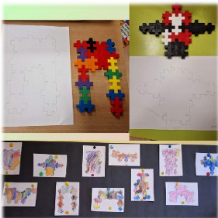
6 pav.: Vaizduotė sukuria įvairius sprendimus ir alternatyvas loginiam mąstymui. Naudinga loginio mąstymo įvedimui spręsti situacijas „jeigu - tai“ (Vilniaus Salininkų lopšelis-darželis, Lietuva, Kokie gali būti robotai ir kam jie skirti?)

Šis būdas integruoja fiziškai aktyvias, raidos tarpsnį atitinkančias patirtis su kompiuterinio mąstymo elementais. Pavyzdžiui, vaikai gali rasti būdą, kaip atlikti veiklą, arba suplanuoti žingsnius, reikalingus tikslui pasiekti. Ankstyvajam loginiam samprotavimui naudinga įtraukti vaikus į „jei–tada“ situacijų sprendimą. Vaizduotė kuria skirtingus sprendimus ir alternatyvas loginiam mąstymui“ (6 pav.). Ypač naudinga skatinti juos ieškoti ir atrasti ne vieną, o kelis sprendimus.