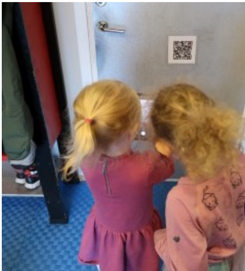
9 pav.: „Paukščio ir transporto priemonės slėpynės“ naudojant QR kodus – „Mūsų mama tai naudoja savo darbe, derindama virtualias ir realias patirtis, kad padėtų vaikams suprasti emocijas“ (Brennastubben Familibarnehage, Oslas, Norvegija)

Pusiausvyra tarp technologijų naudojimo ir vaikų natūralios raidos pasiekama tada, kai technologijos naudojamos tikslingai ir saikingai, kai veiklos yra trumpos ir aiškiai apibrėžtos, o vaikai nepaliekami vieni su ekranais. Tokiu būdu virtualios ir realios patirtys yra derinamos, užtikrinant, kad technologijos nepakeistų gyvo bendravimo, žaidimo ir aplinkos tyrinėjimo. Kuriamos situacijos, kurios skatina bendradarbiavimą, emocijų atpažinimą ir taisyklių kūrimą. Pavyzdžiui, vaikai mokosi įvardyti emocijas arba atpažinti ugdymo aplinkas, kuriose tos emocijos pasireiškia (9 pav.).