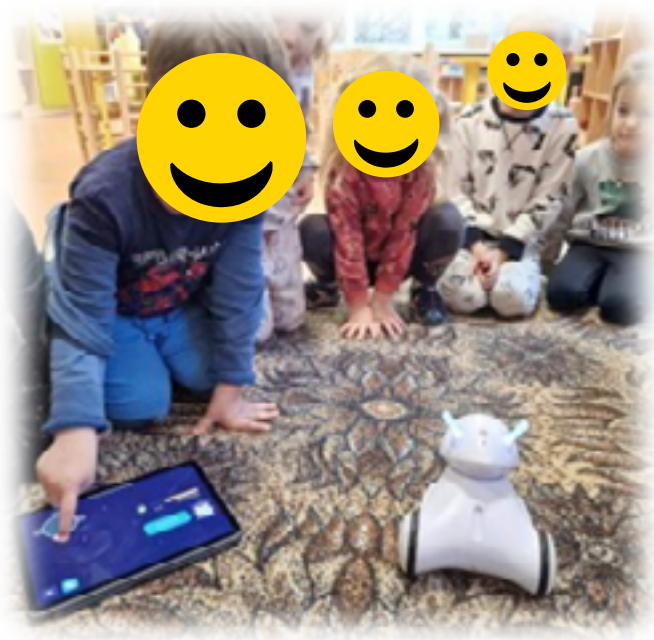
2 pav.: Judesio pojūčio iliustracija algoritminio mąstymo ugdymui (Vilniaus Salininkų lopšelis-darželis, Lietuva, Kokie gali būti robotai ir kam jie skirti? „Vaikų koordinacijos įgūdžių ugdymas per judesiais grįstą veiklą su robotu Photon“)

Kinestetinis pažinimas vykdomas per judesio pojūtį, motorikos lavinimą, patyriminę veiklą, orientuotą į kūno pojūčius, ir pan. Taip padedame vaikams suvokti ir įsiminti informaciją bei pritaikyti informacijos priėmimą jų amžiui (2 pav.).