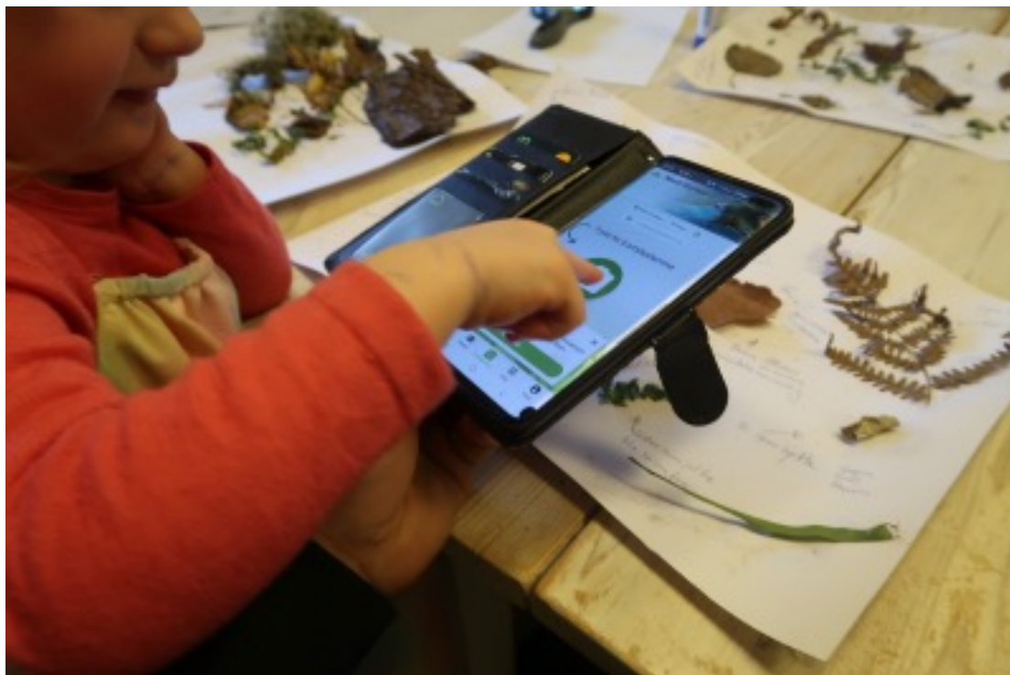
3 pav.: Sensomotorinė veikla, skirta algoritminiam mąstymui ugdyti (Brennastubben Familibarnehage, Oslo, Norvegija. Gamtos elementų paieška: vaikų surinktų lapų atpažinimas, tyrinėjimas ir klasifikavimas).

judėjimas (bėgimas, šokinėjimas, laipiojimas) yra esminė pažinimo ir emocinės raiškos priemonė. Vaikai tampa aktyviais dalyviais, o ne pasyviais stebėtojais. Interaktyvi veikla, žaidimai ir modeliavimas skirti vaikų tyrinėjimo, eksperimentavimo ir problemų sprendimo veiklos organizavimui. Vaikai mokosi per patirtį, aktyviai judėdami, liksdami ir manipuliuodami objektais (3 pav.).